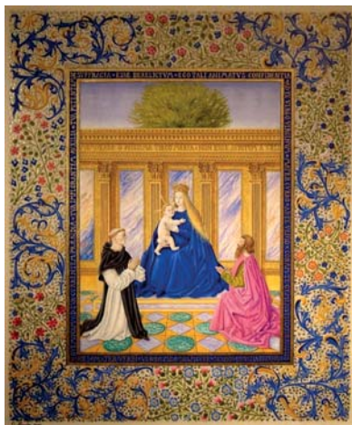
La Vierge présentant l'enfant Jésus à Saint Dominique