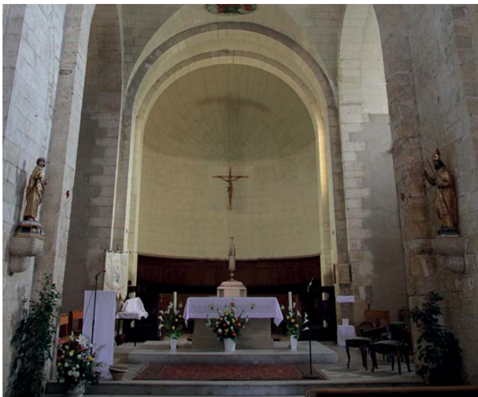
Istres, Notre Dame de Beauvoir - Intégration du projet du reliquaire au fond du chœur