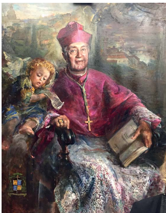
Huile sur toile peinte par Mme Natalia TSARKOVA