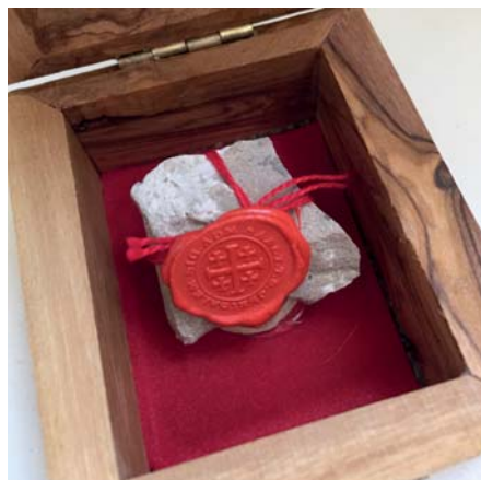
Relique du rocher du Golgotha