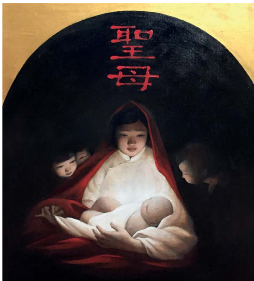
YIN XIN Nativité - Huile sur toile, Cathédrale de Paris