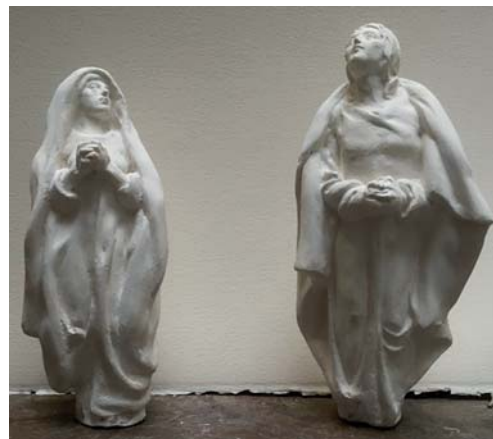
Maitres modèles de la Vierge et st Jean

Destiné à être placé au fond de l'abside de l'édifice, le reliquaire du Golgotha a été conçu pour être vu depuis la porte d'entrée du sanctuaire. Il sera constitué de deux parties, l'une fixe et l'autre mobile, permettant à cette dernière d'être promenée en procession ou d'être mise plus facilement en sécurité. Mgr Bruguès présidera la cérémonie d'installation qui débutera par la procession du reliquaire à travers les quartiers médiévaux de la ville.