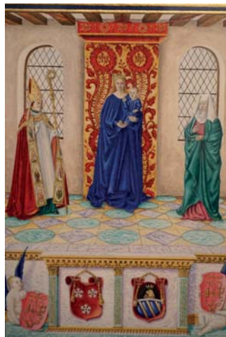
Ste Anne et St Gerard