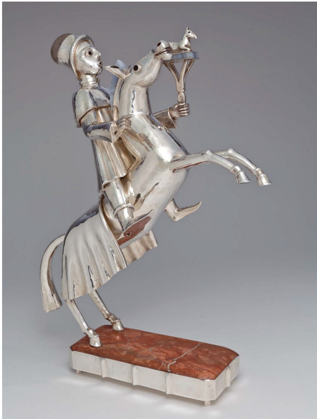
Un chemin de Damas, Goudji.

Afin de mettre en œuvre cette manifestation, Art sacré II s'est donc lancée dans la recherche de 12 mécènes dont la générosité s'avère indispensable à la poursuite de ce projet. (Pour toute information complémentaire et l'envoi du dossier de présentation, veuillez contacter le 06 33 36 00 57).